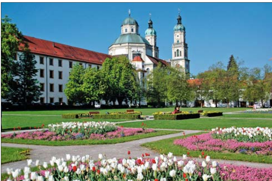
Hofgarten, St. Lorenzbasilika und die Kemptener Residenz bilden eine stimmungsvolle Bühne für die „Fürstensaal Classix“.

K empten im Allgäu ist ein beachtliches 65.000-Einwohnerstädtchen in Deutschlands südlichster Ferienregion. Mitten im überschaubaren Innenstadtkern liegt die im 17. Jahrhundert entstandene Stiftskirche St. Lorenz, deren Doppelturmfassade genauso ein Wahrzeichen der Stadt bildet wie die hinter der Basilika liegende Fürstbischöfliche Residenz. Diese wurde zwischen 1651 und 1674 von Michael Beer und Johann Serro erbaut. Die Residenz hatte als Benediktinerkloster und Regierungssitz eine Doppelfunktion. Die reiche Rokoko-Ausstattung ist weitgehend original erhalten geblieben und einmalig im süddeutschen Raum. Sehenswert ist auch der Fürstensaal, in dem die Fürstbischöfe einst aus ihren Ölgemälden blickten. Ein wahrlich adeliges Ambiente für ein Kammermusikfestival.