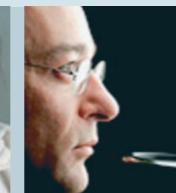
Philippe Berrod Klarinette Solo-Klarinettist des Orchestre de Paris; Preisträger der Wettbewerbe in Paris und Prag