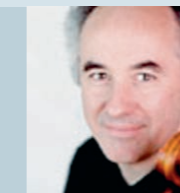
Gustav Rivinius Violoncello Professor an der Musikhochschule Saarbrücken; 1. Preis- träger des Tschai- kowsky-Wettbewerbs Moskau