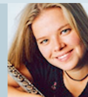
Rozália Szabó Flöte Solo-Flötistin der Sächsischen Staatskapelle Dresden; Preisträgerin der Wettbewerbe in München (ARD) und Paris (Jean-Pierre Rampal)