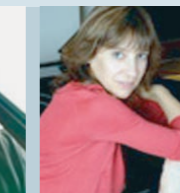
Claire Désert Klavier Kammermusikpartnerin renommierter Solisten; Einladungen zu wichtigen Festivals; mehrere mit Preisen ausgezeichnete CD-Einspielungen