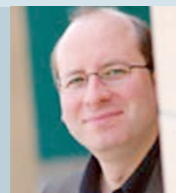
Oliver Triendl Klavier Über 50 CD-Einspielungen mit renommierten Orchestern und Kammermusikpartnern; besonderes Interesse für Repertoire-Entdeckungen und zeitgenössische Musik